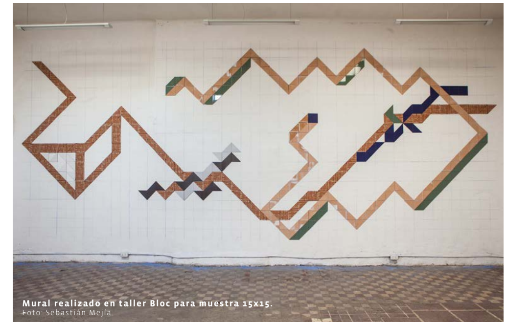
Mural realizado en taller Bloc para muestra 15x15.